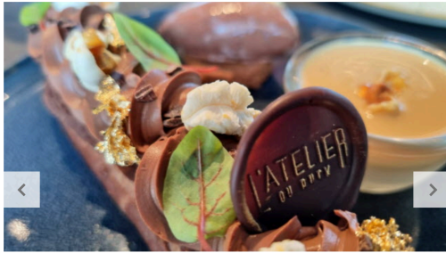
03 / 07 Le choco'ruck, un éclair très chocolaté et sa crème au pop-corn.