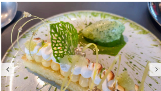
05 / 07 Le lemon ruck'ette, un dessert réussi, qui s'accompagne d'un sorbet au pesto roquette.