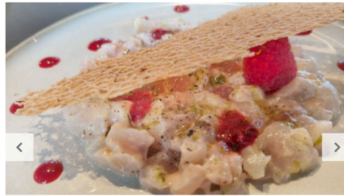
04 / 07 Ceviche de filet de daurade, framboises, citron vert et menthe fraîche.