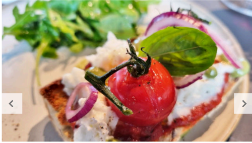
01 / 07 Brunch de tomates, mozzarella et pesto.