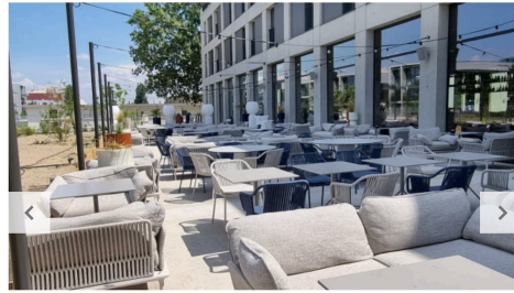
02 / 07 La belle terrasse permet de profiter des beaux jours.