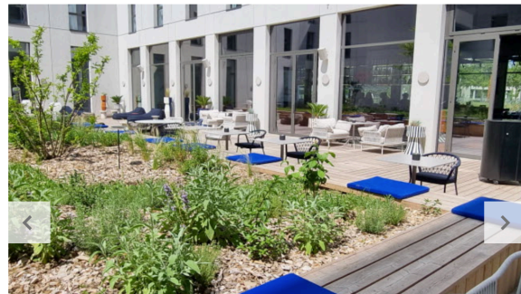
06 / 07 À l'arrière du bâtiment, une terrasse piétonne pour profiter des beaux jours.

Et bonne nouvelle : on n'est pas forcé d'être rugbyman pour y déguster la cuisine d'Alexis Courbière et de sa pâtissière. Parlons tout de suite des desserts, d'ailleurs ! Les chefs ont créé leur propre chocolat, équilibré comme ils le souhaitent : « tourbé, un peu fumé, et peu sucré » explique Constance Patrino, qui fait preuve d'une belle créativité. Un chocolat à découvrir dans l'éclair choco'ruck côté salé, parmi les plats phare du moment, le carré d'agneau mariné, cuit sous-vide en basse température, puis snacké, tranché, accompagné d'un cannelloni de courgettes garni d'une compotée de ratatouille, avec du jus d'agneau réduit à la sarriette... À moins qu'on ne lui préfère le très estival ceviche framboise, citron vert et menthe fraîche, ou les raviolis maison aux gambas.