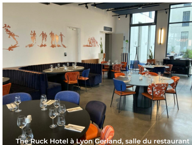
The Ruck Hotel à Lyon Gerland, salle du restaurant

Nous proposons un produit adapté et adaptable, du cousu main. Nous savons écouter leurs besoins pour proposer à nos clients une offre correspondant parfaitement à leurs attentes. Notre grande force est de disposer d'espaces modulables et d'une équipe où règne l'entraide et le partage. Nos équipes développent un esprit chaleureux et ouvert. De plus, The Ruck Hôtel dispose 134 chambres à la décoration épurée, de salles lumineuses, d'un accès au stade. Tous ces atouts permettent de faciliter l'organisation de séminaires, une accessibilité facile avec une proximité des axes routiers et du métro. Enfin, nous disposons du savoir-faire de GL events et du LOU Rugby, à la pointe en termes de technologies et spécialiste dans la préparation d'événements.