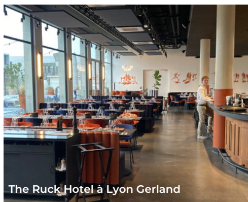
The Ruck Hotel à Lyon Gerland

L'année 2023 a été intense avec la Coupe du Monde et de nombreux salons. Difficile de rivaliser en termes d'émotion et d'intensité. À ce titre, nous ambitionnons de maintenir notre activité, notamment en touchant une clientèle de particuliers à qui nous allons pouvoir offrir l'opportunité d'accéder à la nouvelle piscine de Gerland, qui ouvrira au mois de juin. C'est un véritable atout. Cette clientèle de loisirs et ses particuliers pourront ainsi profiter d'un quartier moderne et innovant en se préservant des inconvénients du centre et les nuisances sonores. Les familles pourront également accéder au stade en tout tranquillité pour profiter de l'ambiance des matchs à Gerland, au Matmut Stadium.